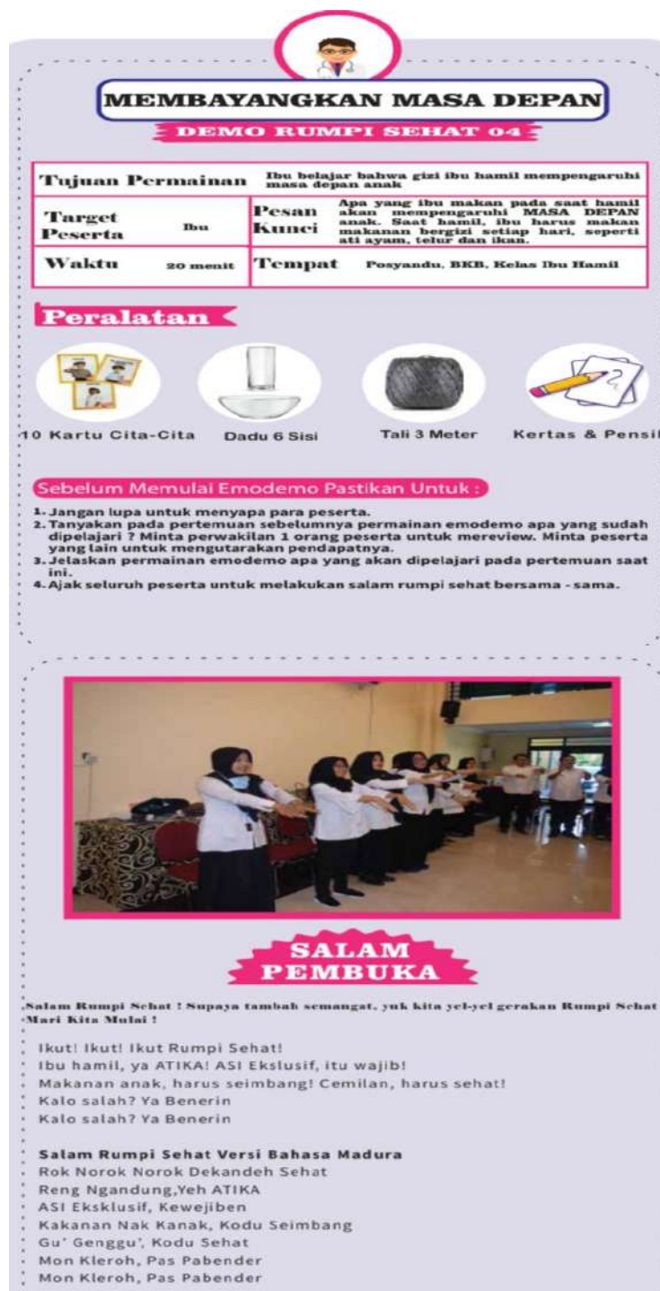
Gambar 1. Modul Emo-Demo Membayangkan Masa Depan