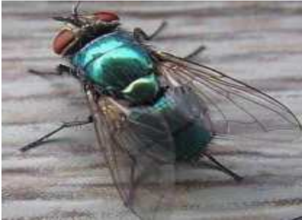
Gambar 3 Lalat Hijau ( Chrysomya Bezziana Villeneuve )