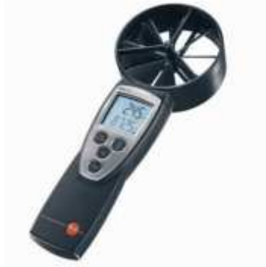
Gambar 12 Anemometer.