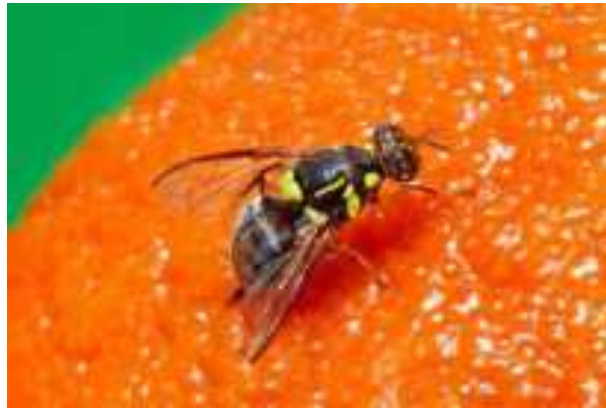
Gambar 4 Lalat Buah ( Drosophila Melanogaster Meigan )

banyak di daerah tropis. Habitat dapat ditemukan di padang pasir, hutan hujan tropis, kota, dan rawa. Sebagian besar spesies berkembang biak (habitat) berbagai jenis tanaman membusuk dan bahan jamur, termasuk buah dan sayuran mengalami fermentasi, kulit kayu, lender, bunga, dan jamur 4 . Lalat Buah dapat dilihat pada gambar dibawah ini.