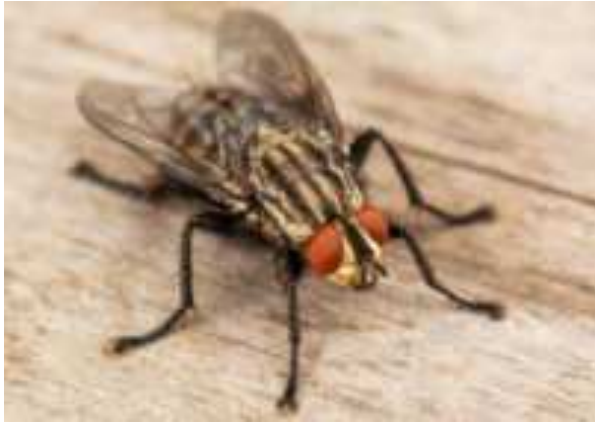
Gambar 2 Lalat Rumah ( Musca Domestica )