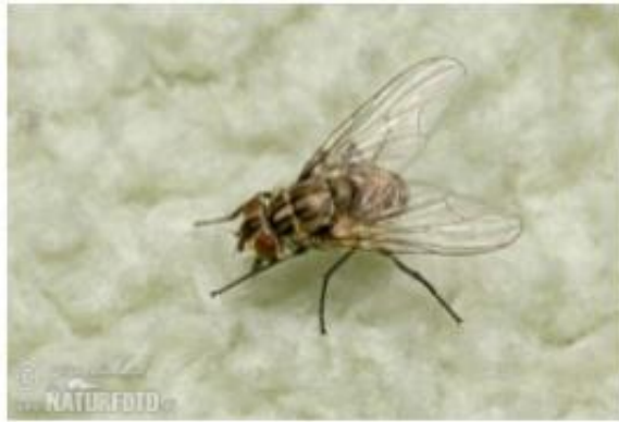
Gambar 8 Lalat Kandang ( Stomoxys Calcitrans )