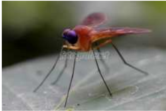
Gambar 6 Lalat Sandy-Lalat Pasir ( Fannia canicularis Linnaeus)