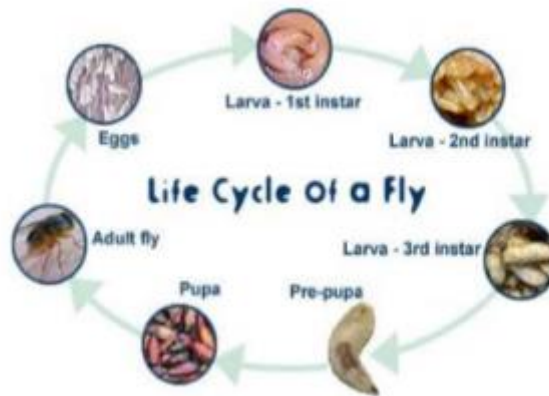
Gambar 1 Siklus Hidup Lalat

Umur lalat pada umumnya sekitar 2-3 minggu, tetapi pada kondisi yang lebih sejuk biasa sampai 3 (tiga) bulan. Lalat tidak kuat terbang menantang arah angin, sebaliknya lalat akan terbang jauh mencapai 1 kilometer. Dalam kehidupan lalat dikenal ada 4 (empat) tahapan yaitu mulai dari telur, larva, pupa dan dewasa 12 .