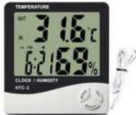
Gambar 13 Humidity Meter