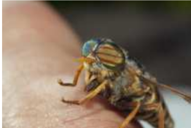
Gambar 7 Lalat Kuda ( Hippobosca Equina )

sekitarpangkal ekor atau diantara kaki 4 . Lalat Kuda dapat dilihat pada gambar dibawah ini.