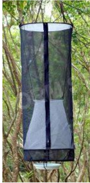
Gambar 11 Bait Trap