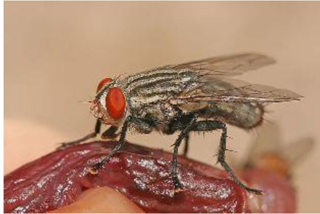
Gambar 5 Lalat Daging ( Sarcophaga Haemorrhoidalis )