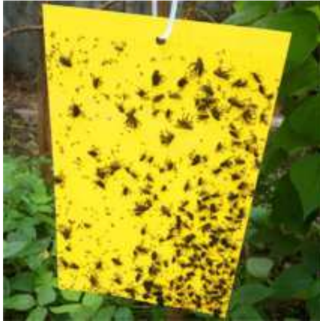
Gambar 10 Sticky Trap